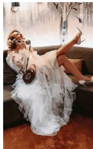
Hochzeiten gehören zum Portfolio der Struves.